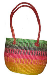
Bolga Bag Rainbow mit Seil und Leder