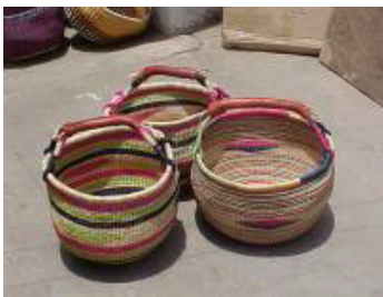
Pastel colour Standard basket