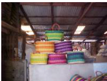
Rainbow uni auf Shopper

Weitere Baskets sind Aufbewahrungskörbe in eckiger Form mit oder ohne Deckel.