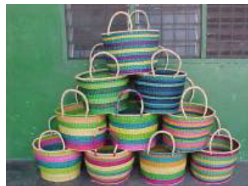
Woodlot basket mit Streifen

Weitere Baskets sind Aufbewahrungskörbe in eckiger Form mit oder ohne Deckel.